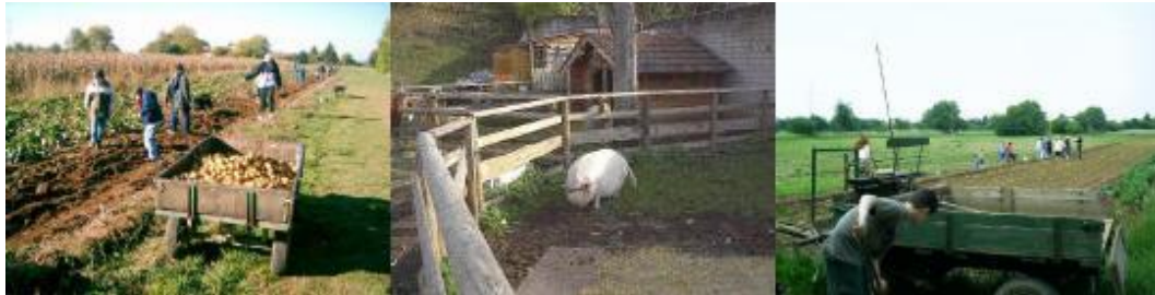
Abbildung 2: Jugendhof Heidelberg

dauerhaft gewährleistet (vgl. Jugendhof Heidelberg e. V. 2009). Mittlerweile werden straffällig gewordene Jugendliche zum Ableisten von Arbeitsstunden überwiegend an diese Einrichtung vermittelt (vgl. Helmken 2009, S. 51).