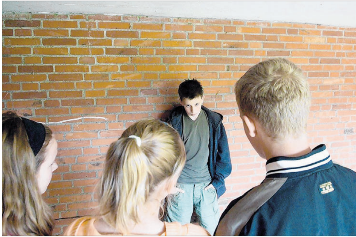
Außensteher und unsichere Schüler werden oft zu Mobbing-Opfern – doch nur, wenn die Mehrheit wegschaut.

Das Interesse ist groß, wie nun eine Präventions-Fachtagung der Polizeidirektion Heidelberg zeigte: Rund 300 Lehrer, Sozialarbeiter und Polizisten waren gekommen, um „Stargast“ Olweus zu hören. Und den Fachleuten wurde schnell klar, dass mit dem Olweus-Konzept, soll es funktionieren, ein Umbruch auf die Schulen zukommen dürfte. „Es ist ein Problem, das wir nicht die Schüler unter sich lösen lassen können“, sagt Olweus. „Es muss klar sein, dass die Erwachsenen in der Schule die Hauptverantwortung tragen.“ Doch nicht alle Lehrer sind mit diesem explizit erzieherischen Auftrag glücklich (siehe nebenstehendes Interview). Ohne Problem-