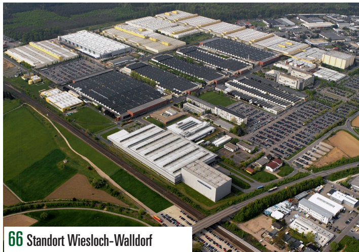
66 Standort Wiesloch-Walldorf